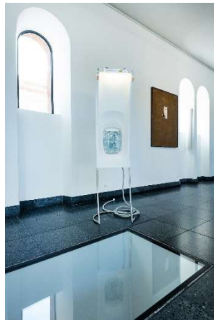
LICHTAUS LICHTAN, Ausstellungsansicht St. Matthäus-Kirche © Norbert Schwontkowski o.T. (Fenster, hinten rechts), 2002 / © Ju Young Kim, Waterline under the water, 2025 (hinten links) / © Micha Ullman Stufen, 2012 (Bodenskulptur Vordergrund)