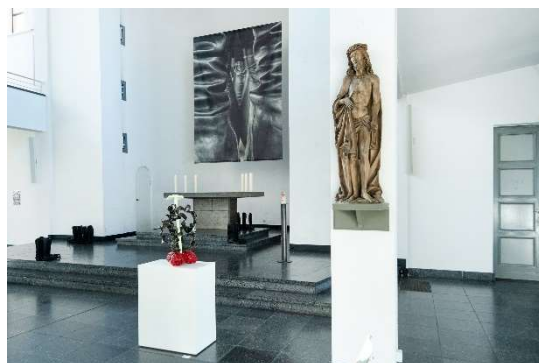
LICHTAUS LICHTAN, Ausstellungsansicht St. Matthäus-Kirche © Kristina Nagel, Untitled, 2024 (Altarbild) / © Lukas Heerich, It was always you, 2025 (Stiefel) / © Guan Xiao, Which one is your sword? No. 2, 2023 (Skulptur Sockel) / Riemenschneider-Schule, Schmerzensmann, um 1500 (Skulptur Pfeiler)