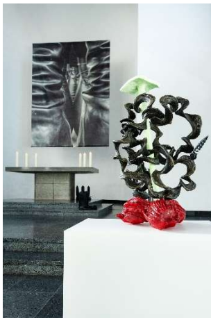
LICHTAUS LICHTAN, Ausstellungsansicht St. Matthäus-Kirche © Kristina Nagel, Untitled, 2024 (Altarbild Hintergrund) / © Lukas Heerich, It was always you, 2025 (Stiefel, Hintergrund) / © Guan Xiao, Which one is your sword? No. 2, 2023 (Skulptur Sockel, Vordergrund)