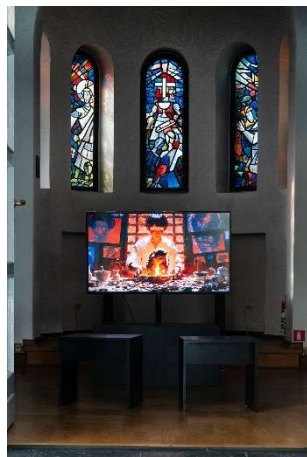
LICHTAUS LICHTAN, Ausstellungsansicht St. Matthäus-Kirche © DOKU, DOKU the Creator – Twelve Nidānas, 2025