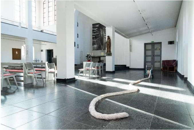
LICHTAUS LICHTAN, Ausstellungsansicht St. Matthäus-Kirche © Nicole Wermers Domestic Tail (White, Spotted Grey, 9 metres), 2025 (Vordergrund)