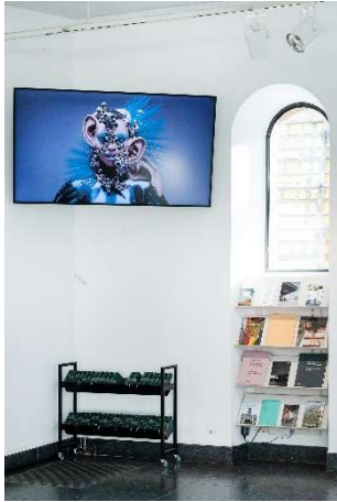
LICHTAUS LICHTAN, Ausstellungsansicht St. Matthäus-Kirche © Vitória Cribb, Observer, 2022 Foto: © Leo Seidel