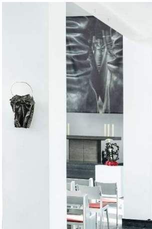
LICHTAUS LICHTAN, Ausstellungsansicht St. Matthäus-Kirche © Kristina Nagel, Untitled, 2024 (Altarbild im Hintergrund) / Guan Xiao, Which one is your sword? No. 2, 2023 (Skulptur auf dem Sockel im Hintergrund), Vadim Sidur, Antlitz, 1971 (Skulptur Vordergrund links)