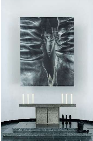
LICHTAUS LICHTAN, Ausstellungsansicht St. Matthäus-Kirche © Kristina Nagel, Untitled, 2024 (Altarbild) / © Lukas Heerich, It was always you, 2025 (Stiefel) / © Guan Xiao, Which one is your sword? No. 2, 2023 (Skulptur im Vordergrund)