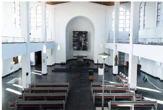
LICHTAUS LICHTAN, Ausstellungsansicht St. Matthäus-Kirche